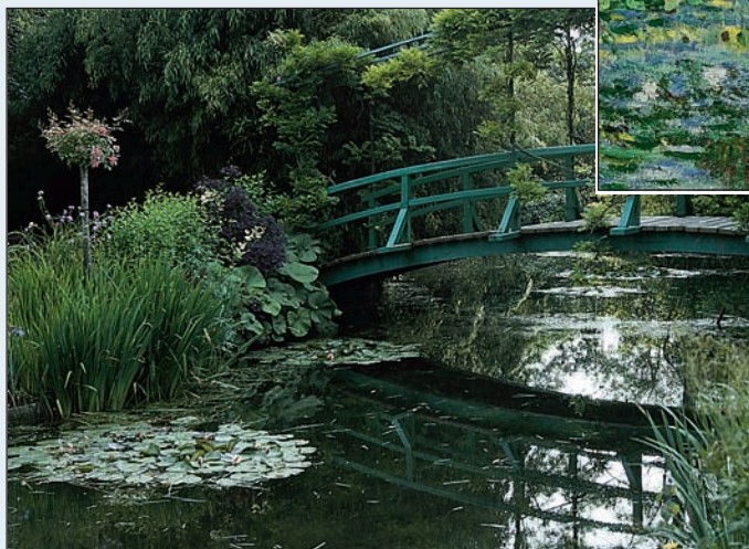
Le jardin de Monet à Giverny